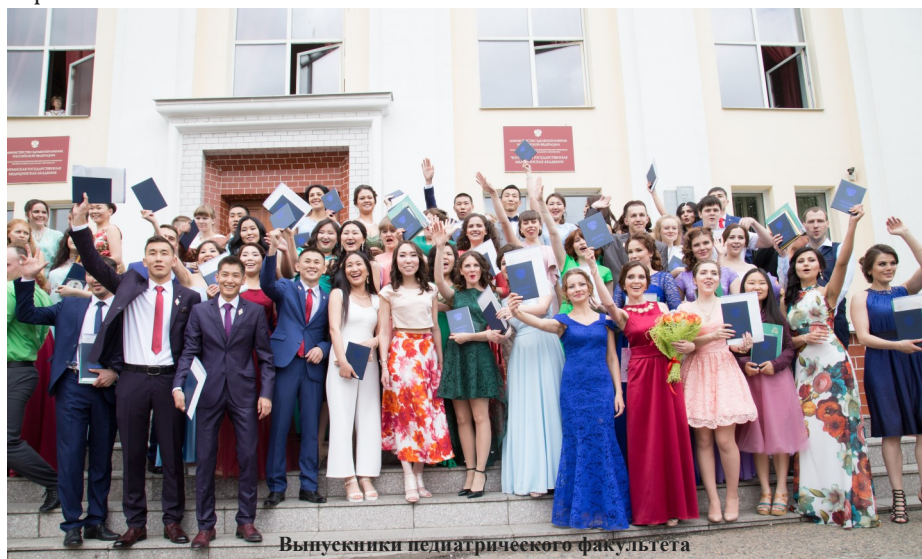
Выпускники педиатрического факультета

ние. Председателем Совета факультета был утверждён декан. При деканате были созданы факультетские комиссии: учебно-воспитательная, методическая, проблемная, стипендиальная и Совет общежития. Оперативно решалась и кадровая политика. Так, в аспирантуру по педиатрии были направлены лучшие специалисты, с отличием окончившие субординатуру и ординатуру. Некоторые преподаватели прошли конкурсный отбор и